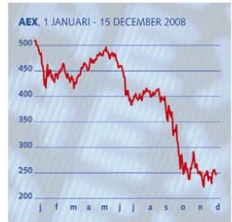
Deze grafiek laat zien dat in 2008 de waarde van de AEX aandelen met 50% is gedaald.

Gevolg van de duikvlucht was uiteraard dat ook de beleggingsportefeuille van Pensioenfonds Hoogovens minder waard werd. Hierdoor verslechterde de financiële positie van het fonds aanzienlijk. <